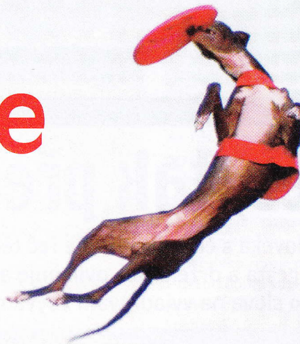
Ashley Junior skákající pro disk

Stále častěji můžete v médiích narazit na zprávy o dogfrisbee alias Disc Dog. Jedná se o jedinečný týmový sport, jehož kouzlo objevuje stále více lidí. Týmový? Ano, člověk a pes tvoří sehraný tým, kde se spoléhá jeden na druhého.