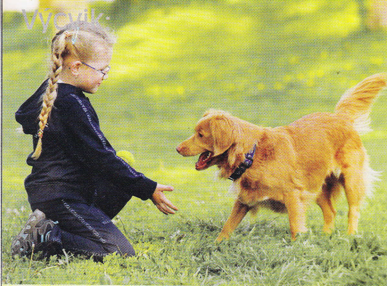
Samotné nabídnutí ruky u mnoha psů automaticky vyvolá zvednutí tlapy