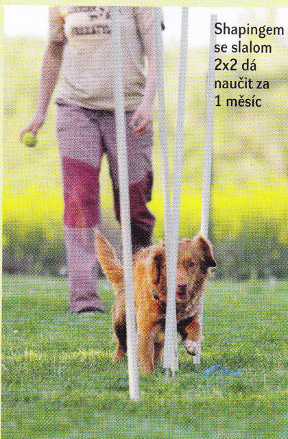
Shapingem se slalom 2x2 dá naučit za 1 měsíc

„vymodelujete“. Chci, aby pes zvedal tlapku? Tlapku zvednu a psa pochválím. Tento způsob pozitivní trenérů v podstatě nepoužívají. Pes je zde zcela pasivní a těžko říct, co se vlastně učí. To není to, co chceme.